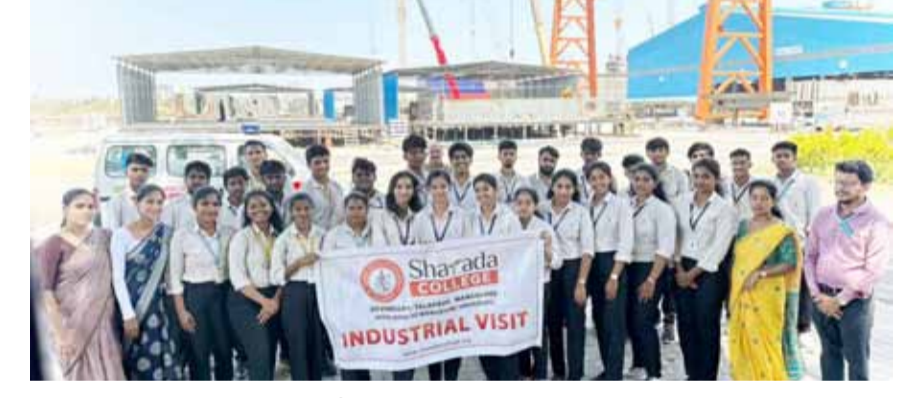
ತಲಪಾಡಿ ಶಾರದಾ ಕಾಲೇಜಿನಿಂದ ವಾಣಿಜ್ಯ ಮತ್ತು ನಿರ್ವಹಣಾ ಸಂಘ ಮತ್ತು ಆಂತರಿಕ ಗುಣಮಟ್ಟದ ಭರವಸೆ ಕೋಶ ವತಿಯಿಂದ ವಿದ್ಯಾರ್ಥಿಗಳ ಪ್ರಾಯೋಗಿಕ ಜ್ಞಾನವನ್ನು ವೃದ್ಧಿಸಲು ಬೆಂಗಳೂರಿನ ಶಿಬಿರ ಯಾತ್ರೆ ಪ್ರವೇಶ ಲಿಮಿಟೆಡ್ ಕಂಪನಿಗೆ ಕೈಗಾರಿಕಾ ಭೇಟಿಯನ್ನು ಮಾಡಲಾಯಿತು. ಒಟ್ಟು 30 ವಿದ್ಯಾರ್ಥಿಗಳು ಭಾಗವಹಿಸಿದ್ದರು. ವಿದ್ಯಾರ್ಥಿಗಳಿಗೆ ಕೈಗಾರಿಕಾ ಕ್ಷೇತ್ರದ ನೈಜ ಪರಿಸ್ಥಿತಿಗಳನ್ನು ಪರಿಚಯಿಸುವುದು ಹಾಗೂ ತಂತ್ರಜ್ಞಾನದ ಬಗ್ಗೆ ಉತ್ತಮ ಮಾಹಿತಿಯನ್ನು ಪಡೆಯುವ ಅವಕಾಶ ಕಲ್ಪಿಸಲಾಯಿತು. ಭೇಟಿಯ ವೇಳೆ ವಿದ್ಯಾರ್ಥಿಗಳಿಗೆ ಶಿಬಿರ ಯಾತ್ರೆ ನ ಕಾರ್ಯವಿಧಾನ ಉತ್ತಮವಾಗಿತ್ತು, ಲಾಜಿಸ್ಟಿಕ್ ನಿರ್ವಹಣೆ, ಮತ್ತು ಸುರಕ್ಷತಾ ಕ್ರಮಗಳ ಬಗ್ಗೆ ವಿವರವಾದ ಮಾಹಿತಿಯನ್ನು ನೀಡಲಾಯಿತು. ವಿದ್ಯಾರ್ಥಿಗಳೊಂದಿಗೆ ಉಪನ್ಯಾಸಕ ವ್ಯವಧವರು ಜೊತೆಗಿದ್ದು ಮಾಹಿತಿಯನ್ನು ತಿಳಿಸಿಕೊಟ್ಟರು.

ಪ್ರಯಾಣಿಕರ ಸುರಕ್ಷತೆಗಾಗಿ ಈ ಬಟನ್ ಒತ್ತಿದರೆ ಅದು ಕಂಟ್ರೋಲ್ ರೂಮ್‌ಗೆ ಸಂದೇಶ ರವಾನಿಸಬೇಕು. ಆದರೆ ಪ್ರಸ್ತುತ ಅಳವಡಿಸಲಾಗಿರುವ ಸಾಧನಗಳು ?ಡಬ್ಬಿಯಾಗಿದ್ದು, ಬಟನ್ ಒತ್ತಿದರೂ ಯಾವುದೇ ಪ್ರತಿಕ್ರಿಯೆ ಸಿಗುತ್ತಿಲ್ಲ. ತುರ್ತು ಸಂದರ್ಭದಲ್ಲಿ ನೆರವು ನೀಡಬೇಕಾದ ಇಆರ್‌ಎಸ್ (ಇಬಿಐ) ವ್ಯವಸ್ಥೆಯೂ ಕುಮಾರ್ ಉಪಸ್ಥಿತರಿದ್ದರು.