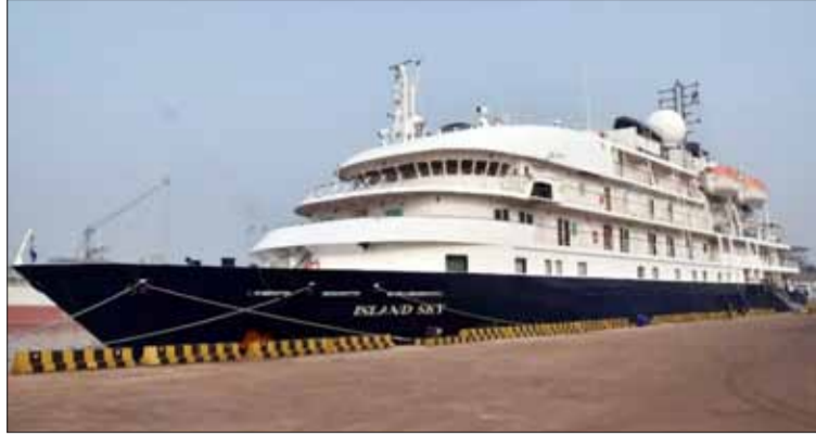
95 ಪ್ರಯಾಣಿಕರು ಮತ್ತು 70 ಸಿಬ್ಬಂದಿಯನ್ನು ಹೊತ್ತ ಕ್ರೂಸ್ ಹಡಗಿನಲ್ಲಿ ಬಂದ ಪ್ರವಾಸಿಗರಿಗೆ ಆಯುಷ್ ಸಚಿವಾಲಯದಿಂದ ಸ್ವಾಸ್ಥ್ಯಶಾಲದ ಮಂಗಳೂರಿನ ಯಕ್ಷಗಾನ ಕಲಾ ಪ್ರಕಾರದ ಸೌಲಭ್ಯವನ್ನು ಒದಗಿಸಿತ್ತು. ಪ್ರವಾಸಿಗರು ಕುಡ್ಯೋಳಿ ಗೋಕರ್ಣನಾಥ ದೇವಸ್ಥಾನ, ಸೇಂಟ್ ಅಲೋಶಿಯಸ್ ಚರ್ಚ್, ಸ್ಥಳೀಯ ಮಾರುಕಟ್ಟೆಗಳು ಮತ್ತು ಕಲ್ಟಿವೆ ಗೋಡಂಬಿ ಕಾರ್ನಾಟ ಸೇರಿದಂತೆ ಮಂಗಳೂರು ಮತ್ತು ಸುತ್ತಮುತ್ತಲಿನ ಪ್ರಮುಖ ತಾಣಗಳಿಗೆ ಪ್ರವಾಸಿಗರು ಭೇಟಿ ಹಡಗು ಮಂಗಳೂರು ಬಂದರಿನಿಂದ ನೀಡಿದರು. ಬಳಿಕ ಮಧ್ಯಾಹ್ನ 1 ಗಂಟೆಗೆ ನಿರ್ಗಮಿಸಿದ.

ಮಂಗಳೂರು: ನವಮಂಗಳೂರು ಬಂದರು ಪ್ರಾಧಿಕಾರವು ಈ ಸಾಲಿನ 2ನೇ ಪ್ರವಾಸಿ ಹಡಗಾದ ಎಂ.ಎಸ್. ಐಲ್ಯಾಂಡ್ ಸೈ ಅನ್ನು ಬಂದರು ತೀರದಲ್ಲಿ ಸ್ವಾಗತಿಸಿದೆ.